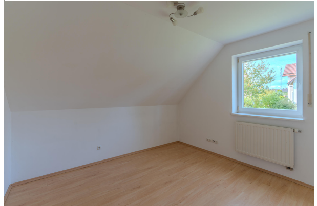
2. sonniges Zimmer im DG