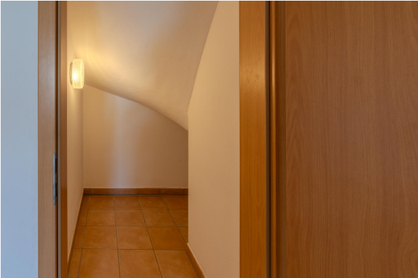
Praktischer Stauraum unter der Treppe!