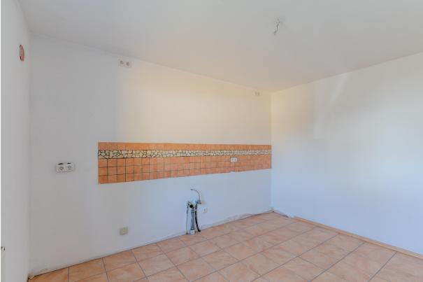
Zur individuellen Gestaltung!