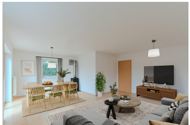
So könnte Ihr neuer Wohnbereich aussehen