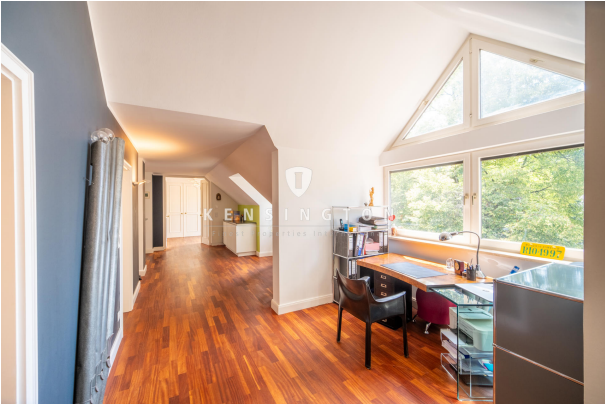
Schreibtisch mit Blick ins Grüne