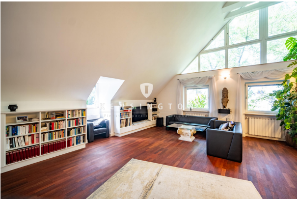
Wohnzimmer mit viel Tageslicht