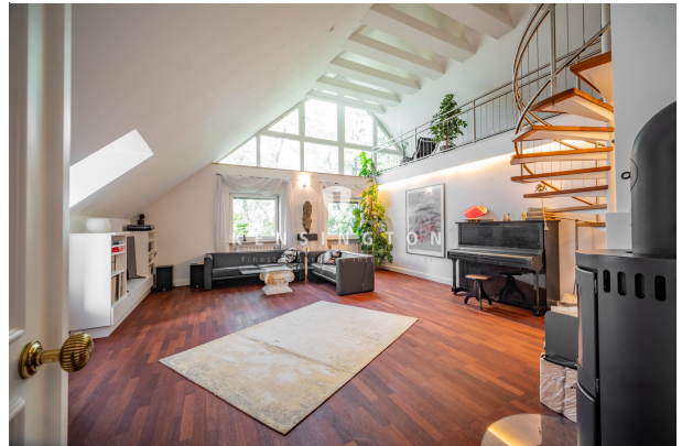
Wohnzimmer mit hohen Decken