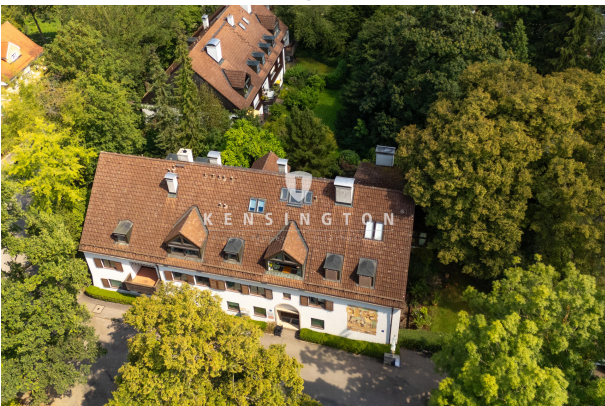
Außenansicht mit Blick ins grüne