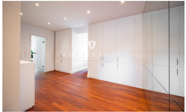
Ankleidezimmer mit Zugang zum Schlafzimmer und Badezimmer