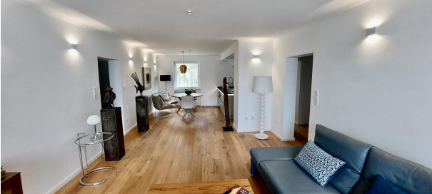
WZ Blick Essbereich II