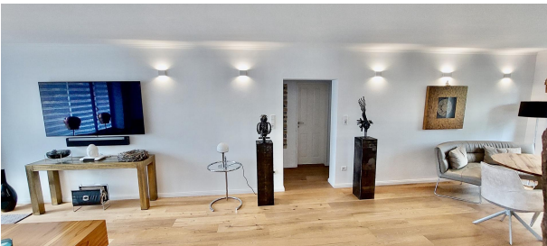
Blick WZ Richtung Bad