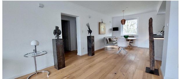
Perspektive von der Sitzecke WZ