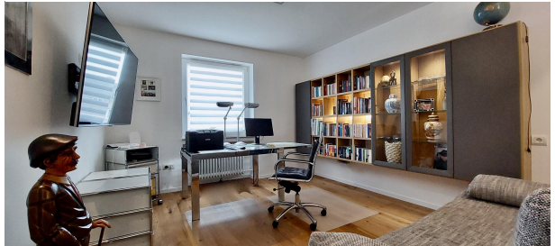
Büro -und TV Zimmer