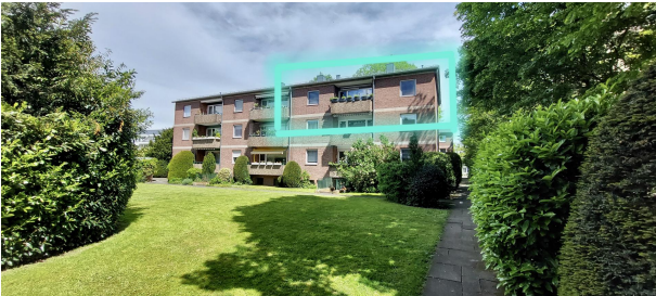
Ansicht Aussen II